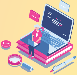
Live/Recorded Online Program