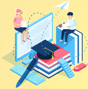
Books & Study Material