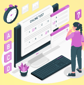
Online Test Series & Quiz